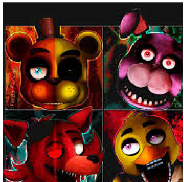
Personajes de Fnaf S/D de autor

Para ahuyentar a nightmare foxy, que está en el armario, hay que cerrar la puerta del armario hasta que se convierta en peluche.